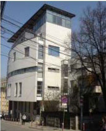
PwC Cluj Napoca